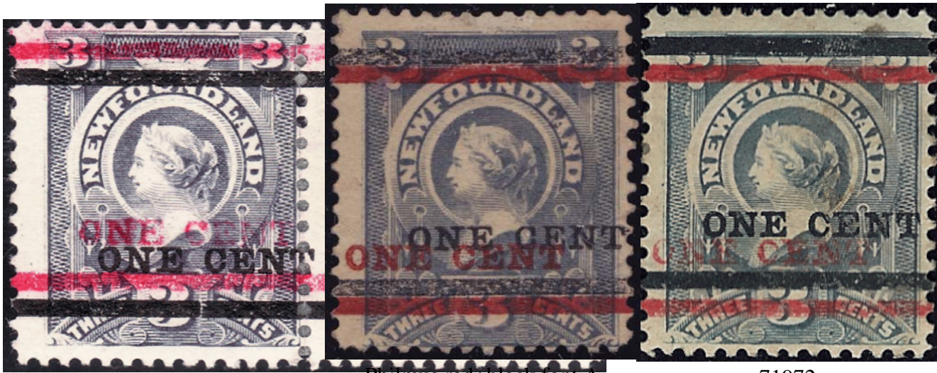
Gratton red+black font A