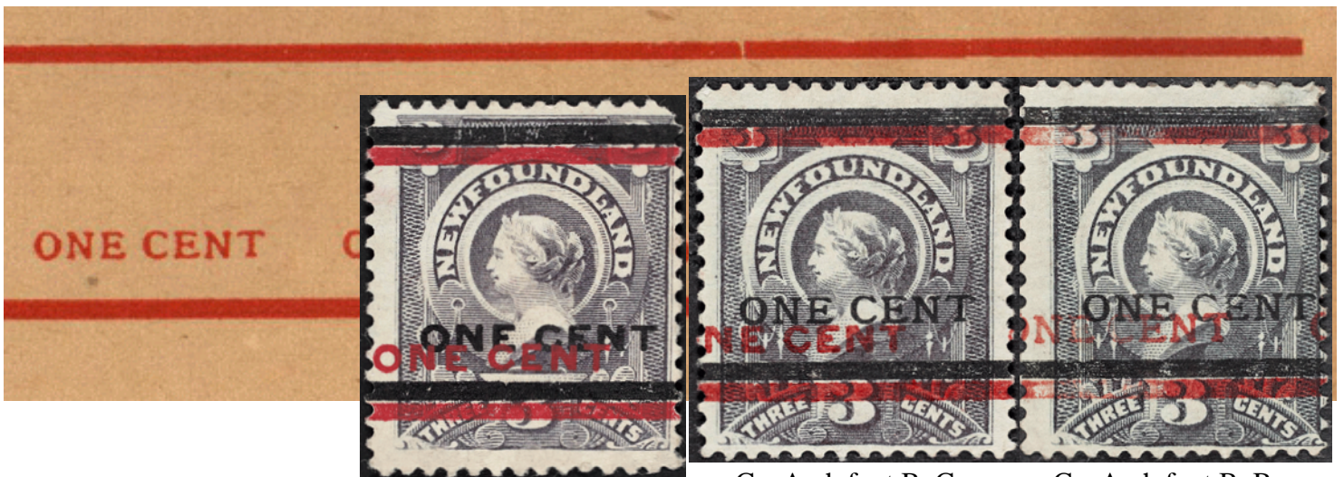
CanArch font C+C

Pareillement, en comparant l'exemplaire de gauche 'CanArch font C + C' aux trois précédents, on voit qu'il n'y a aucune correspondance. Enfin l'exemplaire du milieu 'CanArch font B, C' montre une rupture dans la ligne supérieure de la surcharge en rouge, ce qui identifie sa position.