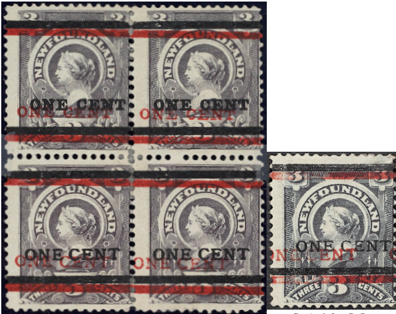
CanArchives double font A top pair; and double font B bottom pair

Ainsi il est montré qu'un minimum de 6 feuilles fut surchargé en rouge et en noir.