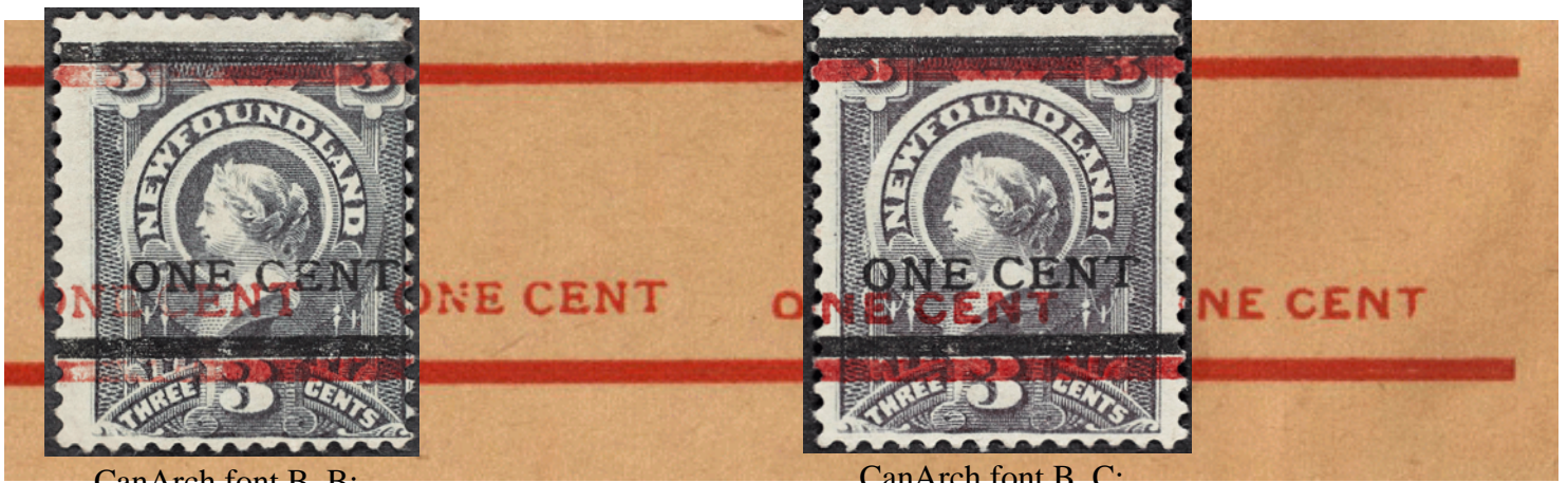
CanArch font B, B; originally site stated as A, C