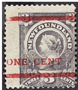
fig. E; off center sheet font B

Cinq feuilles furent surchargées en rouge.